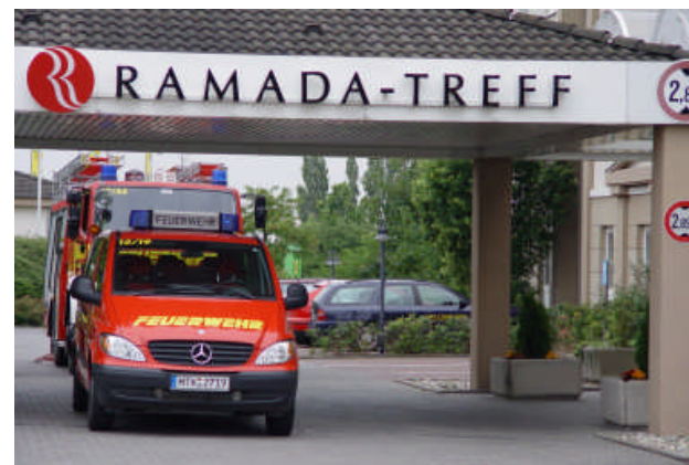
Räumungsübung Ramada Hotel Diedenbergen